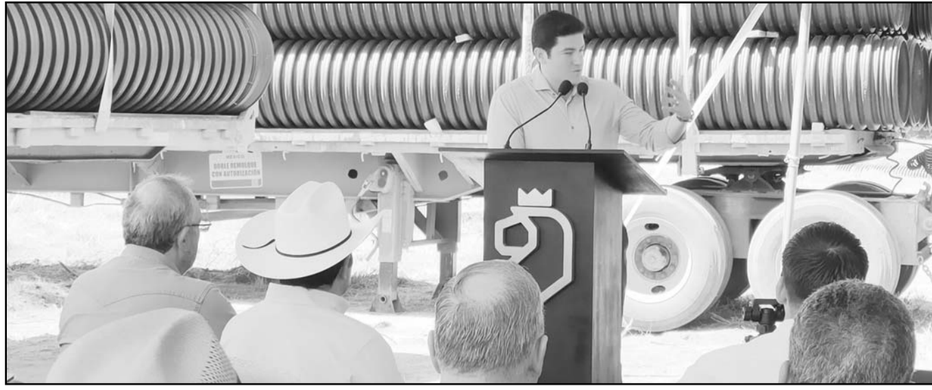
El gobernador, Samuel García tuvo una gira ayer por el municipio de la Región Cítrica del estado