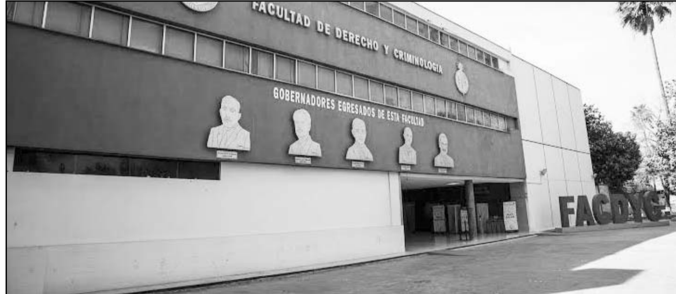
Las elecciones de director, realizadas hace algunas semanas, siguen siendo cuestionadas